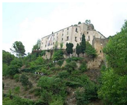
Pronto se iniciará la primera fase para rehabilitar el convento de Agres que se sitúa en el corazón de la Sierra Mariola M. VICEDO

M. VICEDO Agres ha recibido una subvención de 220.000 euros, a través del programa Ruralter, que le permite iniciar la primera fase de restauración del convento que consiste en la demolición del antiguo restaurante y en la construcción, en ese mismo lugar, de un centro para acoger a visitantes y peregrinos. La Fundació per la Restauració del Santuari-Convent de la Mare de Déu d'Agres, integrada por el Ayuntamiento, la Diputación y la Iglesia, viene trabajando desde hace tiempo con este proyecto de recuperación de este emblemático inmueble presupuestado en aproximadamente siete millones de euros. Uno de los objetivos de esta agrupación era buscar financiación para poder acometer la intervención integral de todo este complejo que se sitúa en las estribaciones de la Sierra de Mariola.